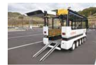
車椅子での乗降も可能

全区間フリー乗降可能 (運転手が安全な場所に車を停めます。) 【定員】11席(先着順)