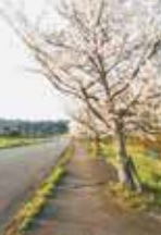
七瀬川沿いの 桜並木